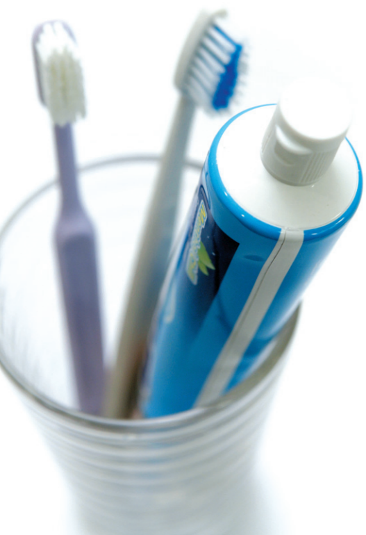
치아 상아질 마모도 · 치아침착물 제거력 실험 결과

이에 반해 '송염은예보진'이나 '암앤해머덴탈케어오리지날' 2개 제품은 나머지 4개 제품에 비해 상대적으로 치아침착물 제거력이 낮은 것으로 나타났다.